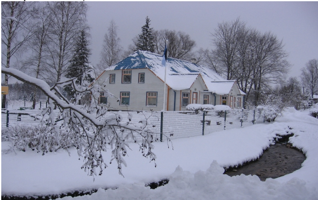
Foto 2. Himmaste algkool

Nad on langeallikad, mille vesi koguneb ojakesse. Oru nõlval imbub maapinnale rohkesti lisaks ka väiksemaid allikaid, moodustades soostunud allikaala. Umbes 1km allavoolu Ora oru paremal veerul paikneb teine allikarühm. Siin avaneb veel 6 langeallikat ja 1 tõusuallikas nn Metsa allikad aga need allikad jäävad juba Eoste küla piiridesse.