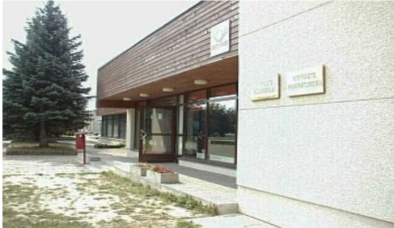
Foto 3. Himmaste vallaraamatukogu/külakeskus

Detsembris 2006 asutati käsitööseltsing "NOBEDAD NÄPUD", käsitööhuvilised olid eelnevalt juba mitmeid aastaid tegutsenud ja koos käinud. Nende eestvõtmisel on koostöös vallaraamatukogu töötajatega korraldatud ülevallalisi käsitöönäitusi ja koolitusi.