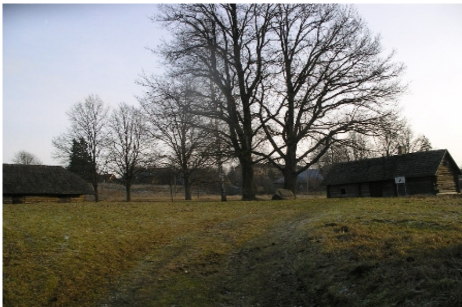
Foto 4. J. Hurda sünnikodu

Aastal 2009 möödus 170. aastat läinud sajandi ühe suurema eestlase Jakob Hurda sünnist. Tema sünnikodu Himmastes on aga praegu lagunenenud ja räämas, rääkimata kaotusest 1975.aastal, mil hävis kahjutules elumaja, kus Jakob Hurt oli sündinud.