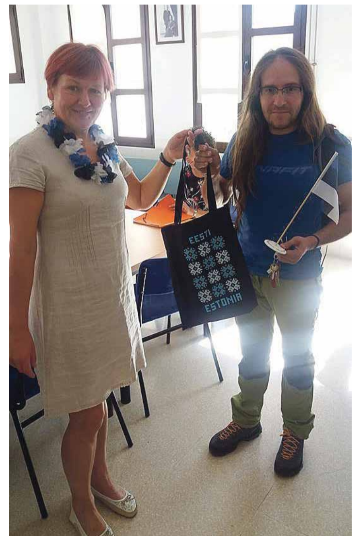
Ene Veberson üle andmas kingitust.

Edukaid õpirände projekte 2018. aastal kõigile Põlvamaa koolidele!