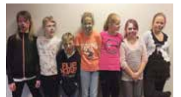
Halloweeni õudusmeigi õpitubas osalejad.

Aasta lõpuni saab noortekeskuse seminariruumis keskuse lahtiolekuaegadel nautida sama programmi fotokoolituse esimese lennu