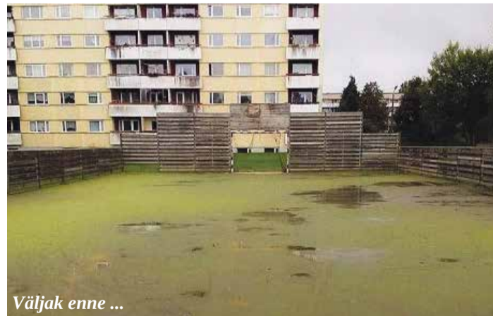
Väljak enne ...