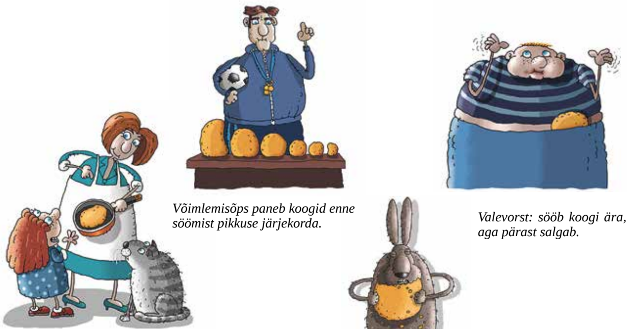
Võimlemisõps paneb kookid enne söömist pikkuse järjekorda.

Vahvad pildid joonistas kunstnik Hillar Mets. Siinkohal on neid avaldatud vaid mõni, ülejäänuid saab vaadata ja sinna juurde kuuluvat teksti lugeda ajakirja Täheke septembrinumbrist.