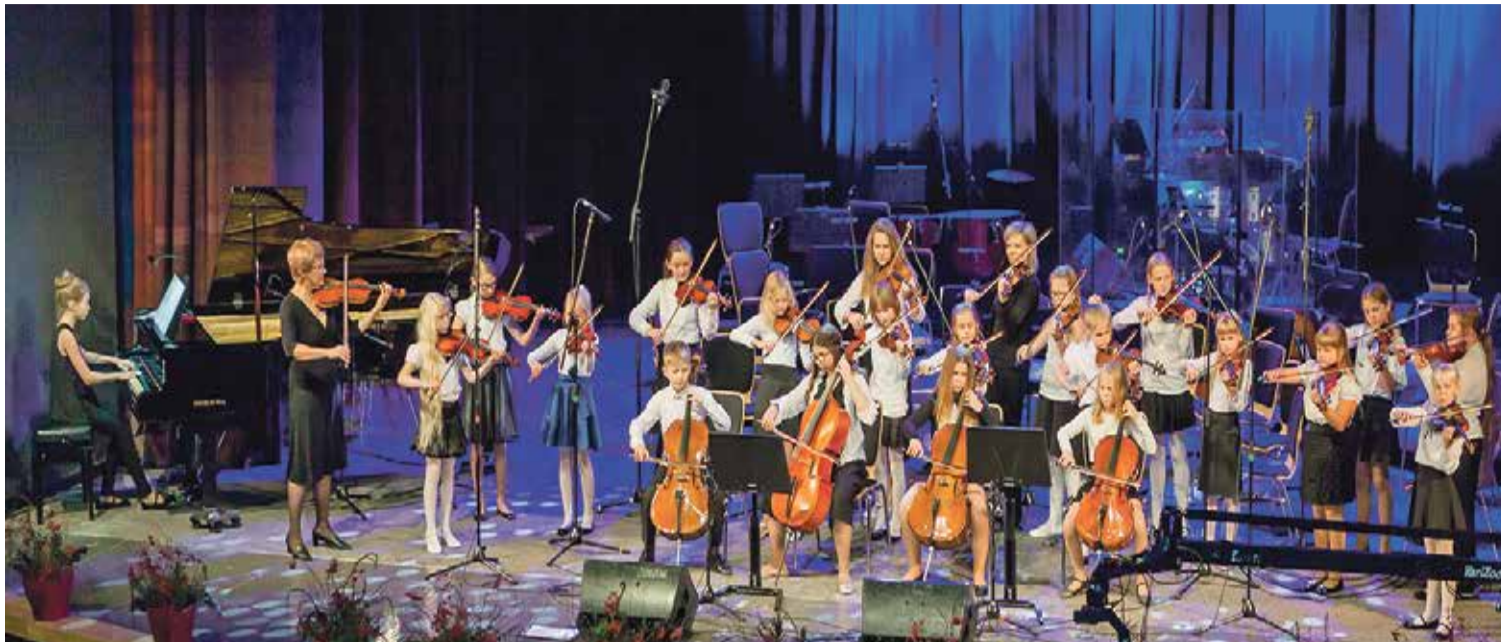
Esineb keelpilliorkestri järelkasv – noorema astme keelpilliansambel.