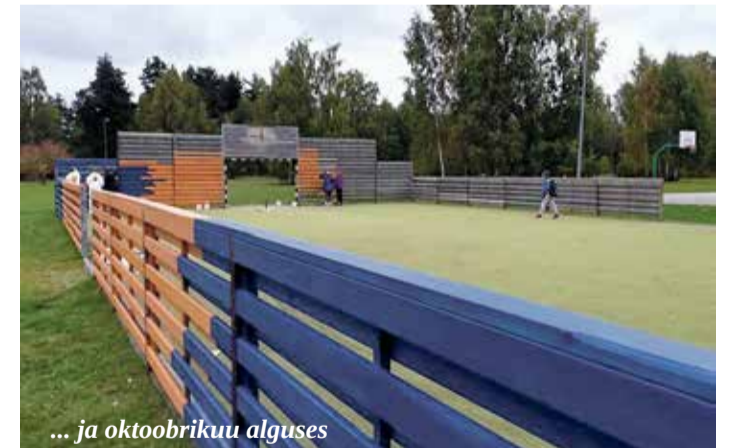
... ja oktoobrikuu alguses

Sellel suvel avati taas noorte piirkondlike ideede projekti-fond Nopi Üles, mis toetab 7-26 aastaste noorte omaalgatuslike ideede elluviimise rahalist toetamist. Projekti tegevused edendavad noorte aktiivset eluhoiakut, panustades kodukoha arengusse.