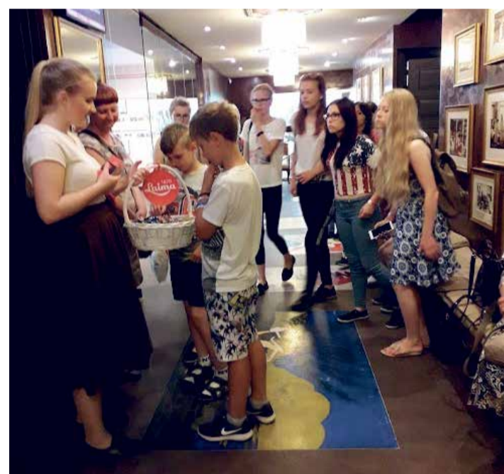
Magus ennelõuna Laima šololaadimuseumis.

7. juunil veetsid õhtu ja öö koolimajas nooremad ja 8. juunil vanemad õppurid. Kuna kõik soovisid kindlasti öö koolis veeta, seati mõlemal õhtul koolimaja jõudes kõigepealt klassides valmis magamisasemed. Järgnes põnev õhtu mängude, võistluste ja viktoriiniga. Kes tahtis lustimisest pisut puhata, võis vaikes nurgakeses lugeda oma lemmikraamatut. Koos küpsetasime pannkooke ja süütasime kaunit kaetud õhtusöögilaul küünlad. Nalja, naeru