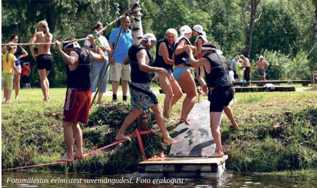
Fotomälestus eelmistest suvemängudest.

Põlva valla X suvemängud toimuvad laupäeval, 21. juulil algusega kell 11.00 Põlvas, Mammaste Tervise- ja spordikeskuses. Jätkame kogupere sündmuse - valla suvemängude traditsiooni.