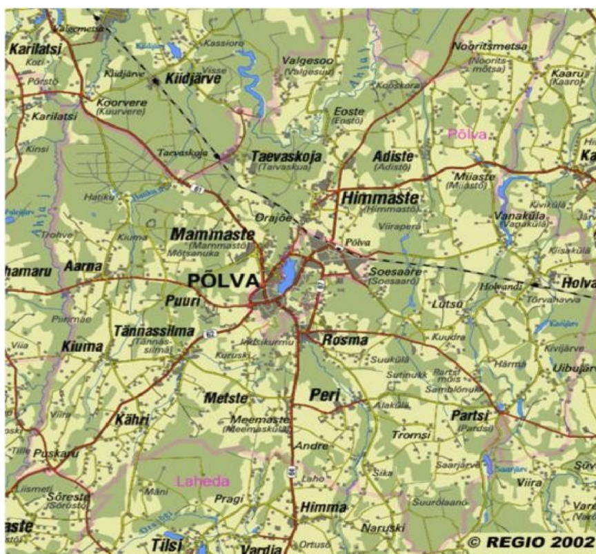
Joonis 1. Piirkonna kaart