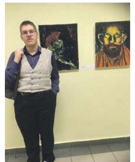
Põlva Kunstikool Kasper Lõiv.

Tõõde teemad eri vanuseklassidele olid erinevad, samuti oli antud vabadus kasutada eri meediume õilmaalist ja akrüülmaalist erinevate joonistustehnikateni. Valminud konkursitööd vormistati näituseks, mis jäi vaatajale avatuks jaanuari keskpaigani Narva Kunstikooli kolmel korrusel.