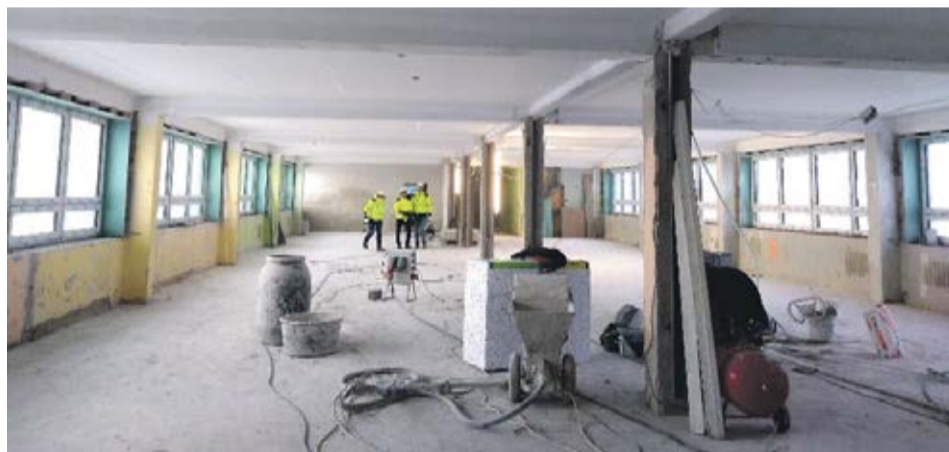
Tööjärg on tulevases söögisaalis.

Tööde järg on sealmaal, et hoone tugi-konstruktsioonide parendustööd, uute välistrasside rajamine ja katusekatte vahetus on teostatud. Samuti on paigaldatud uued aknad ning toimub välisfassaadi soojustamine. Siseroomides viiakse läbi ruumide kaupa nii eritööde teostamist ka viimistlustööd. Ehitushange on läbi viidud selliselt, et peatöövõtja kohustuseks on paigaldada kogu sisustus inventar ja seadmed remonditava hooneosa toimimiseks. Hoonete remonttööde käigus juhtub sageli nii, et alles konstruktsioonide avamisel saab selgeks nende tegelik seisukord ning mis