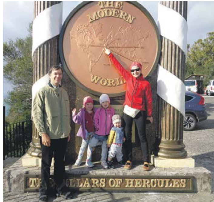
Perega Gibraltaril.

Tämbädsel päeval tulõ õks ette, et elo vii perre kotust ja kolälhküst koolist muialõ ja latsõ opminõ tulõ tõistmuudu kõrralda. Nii juhtusi ka mi perrega – minevä aasta augustist detsembrini ollimi kodomaalt kavvõl. Sõski alost üts mi perre latsist umma koolitiid Tilsni põhikoolin.