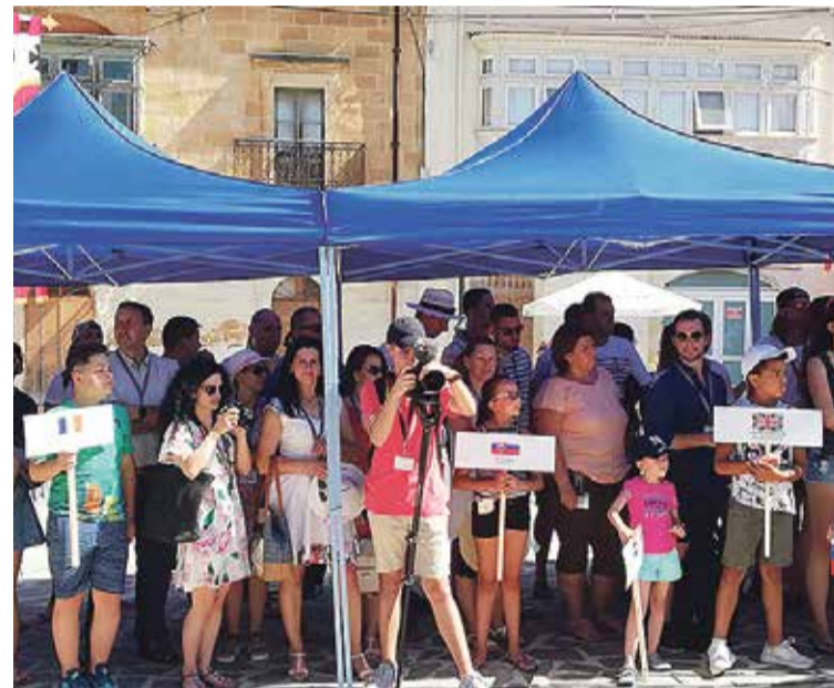
Harta eelmise aastakohtumise avatseremoonial Naduris, Maltal.

Hoidkem üheskoos Euroopas Eesti lippu kõrgel!