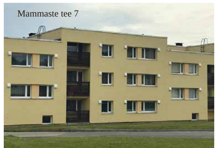
Mammaste tee 7