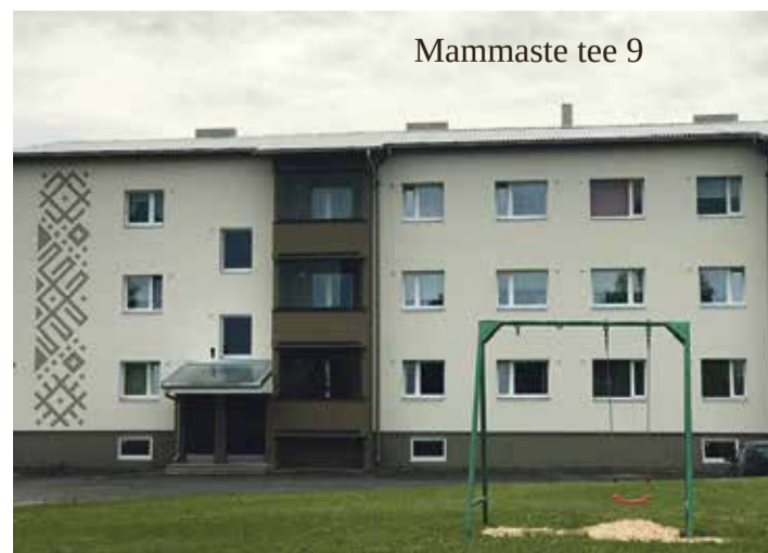
Mammaste tee 9