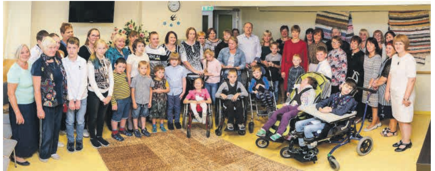
Koolipere koos presidendiga.

Kooliaasta algas meil, nagu teisteski koolides, teiselt: tunniplaanide, ainekavade ja tööplaanide koostamise ning nii paljude jooksvate küsimuste lahendamiseks. Esimese õppeveerandi lõpuks on aga tavapärase koolirütm sisse saadud ning juba täna võime mitmetest meeldejäätavatest sündmustestki kõnelda.