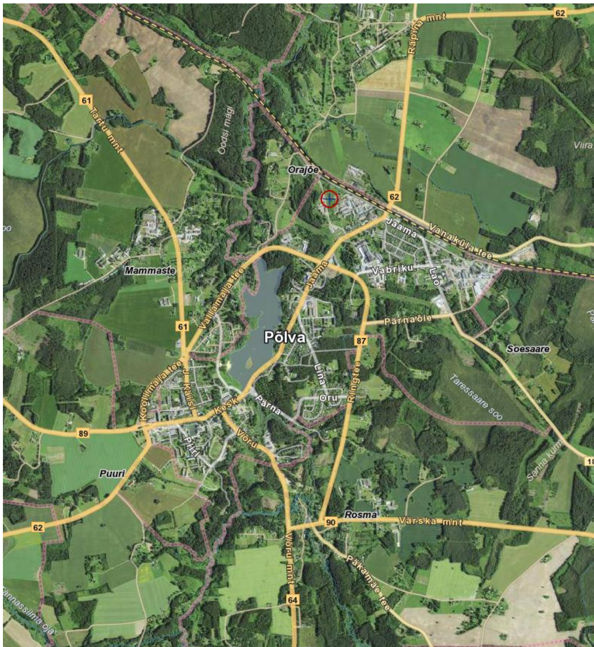
Skeem 1. Asukoha skeem. (Aluskaart: Maa-amet)