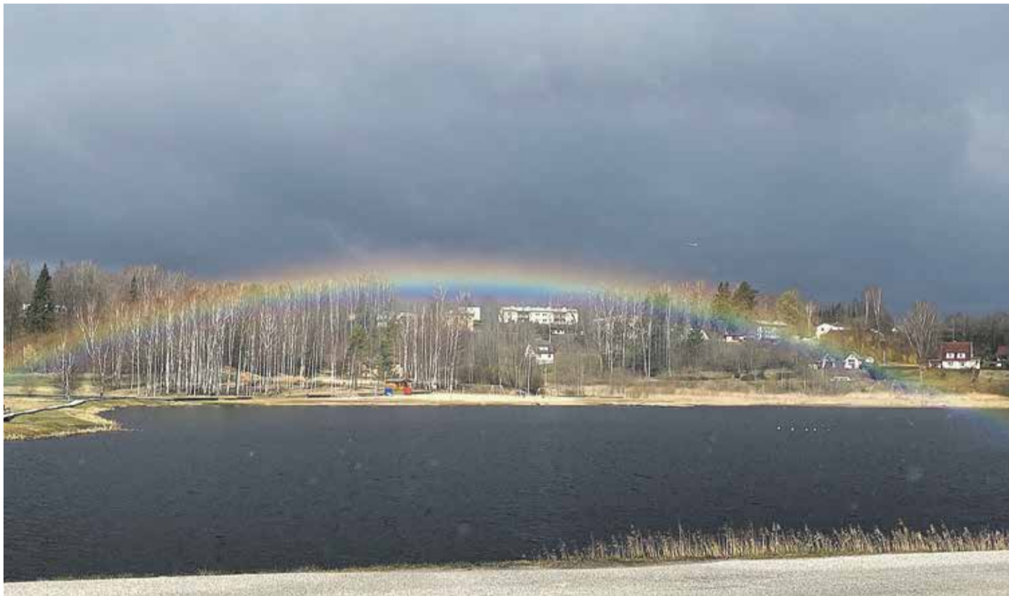
Vikerkaar Põlva järvel 12. aprillil 2020.