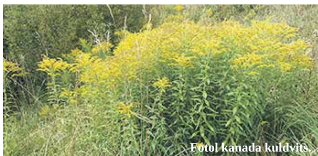
Fotol kanada kuldviits.

Keskkonnaameti liigikaitse peaspetsialist