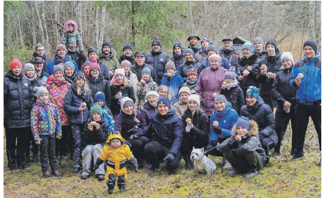
Rosma rahvas tähistamas 2020 vastlapäeva.

Juba 11 aastat on Rosma küla tähistanud 1. mail oma endiste ja praeguste elanikega ühiselt külapäeva. Sel aastal, tulenevalt eriolukorras riigis, külapäeva korraldada ei õnnestu. Küll aga valmib juba traditsiooniks saanud järjekordne Rosma küla kalender 2020/21, mida soovivad saavad tellida, edastades oma soovid e-maili teel tonu@rosma.ee