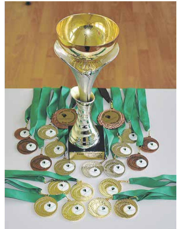
Tilsa Põhikooli selle aasta saak Nutispordi Kagu-Eesti regiooni võistlustelt.

Iga aastaga nutispordilaste arv kasvab (praeguseks on umbes 35 000 nutispordilast üle Eesti) ja koos sellega tõuseb ka võistluste tase. Tilsa Põhikool on igatahes uhke selle üle, et ühest väikesest kohast ja väikesest koolist on nii palju tegijaid matemaatikuid!