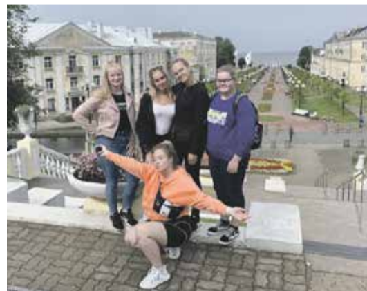
Projektis osalenud Põlva noored Sillamäel.