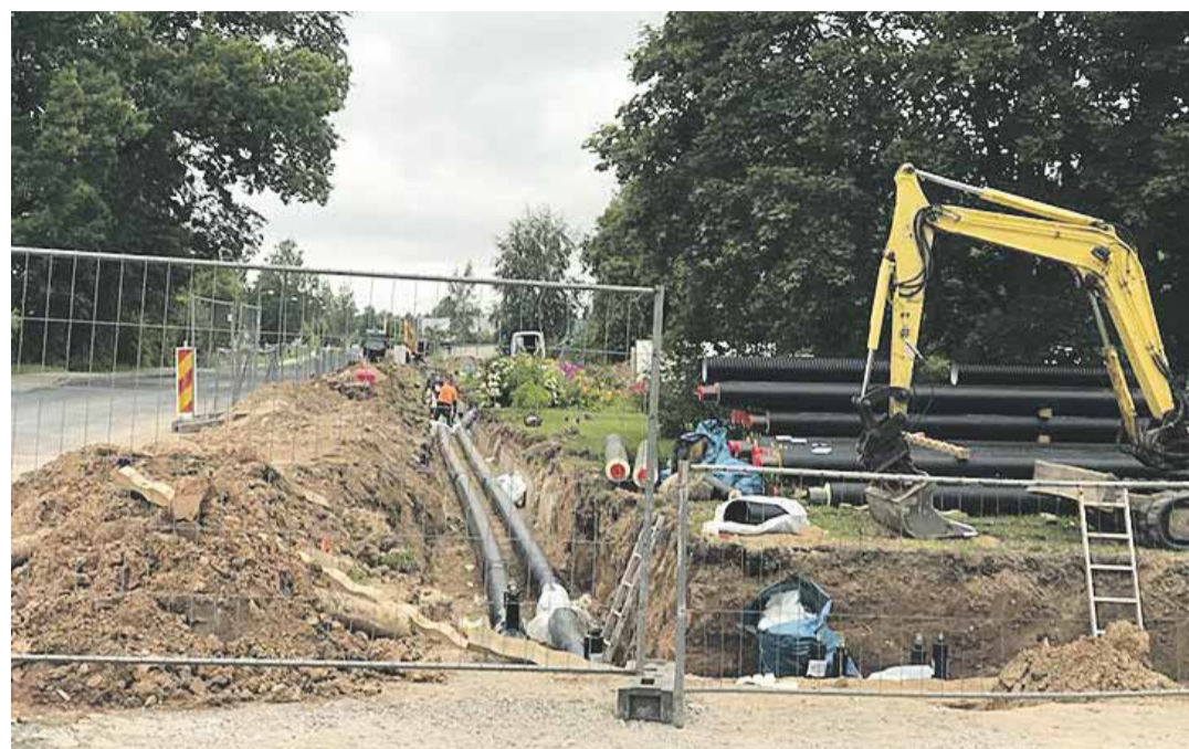
Soojustorustiku ehitustööd.

Soojust soovides, Tarmo Kirotar AS Põlva Soojus juhatuse liige