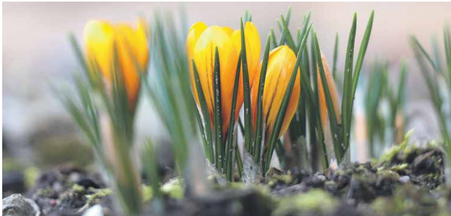
Tere kevad!

Säilitage rahulik meel ja hoidke tervist!