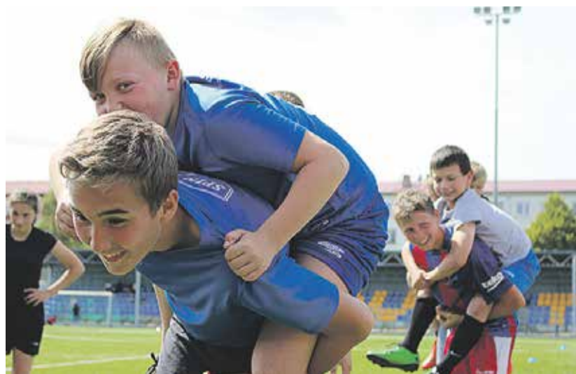
Hetk Narva linnalaagrist.

SPIN-programmi elluviimist rahastab Põlva vallas