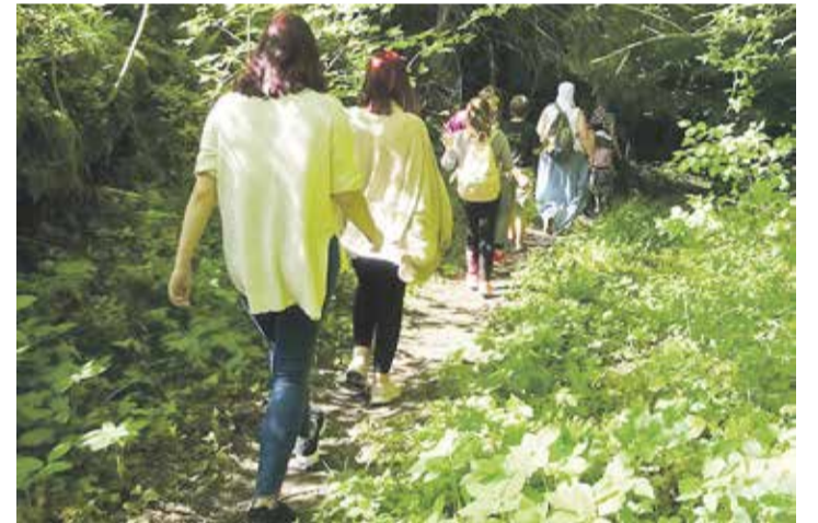
Hanereas allikale.