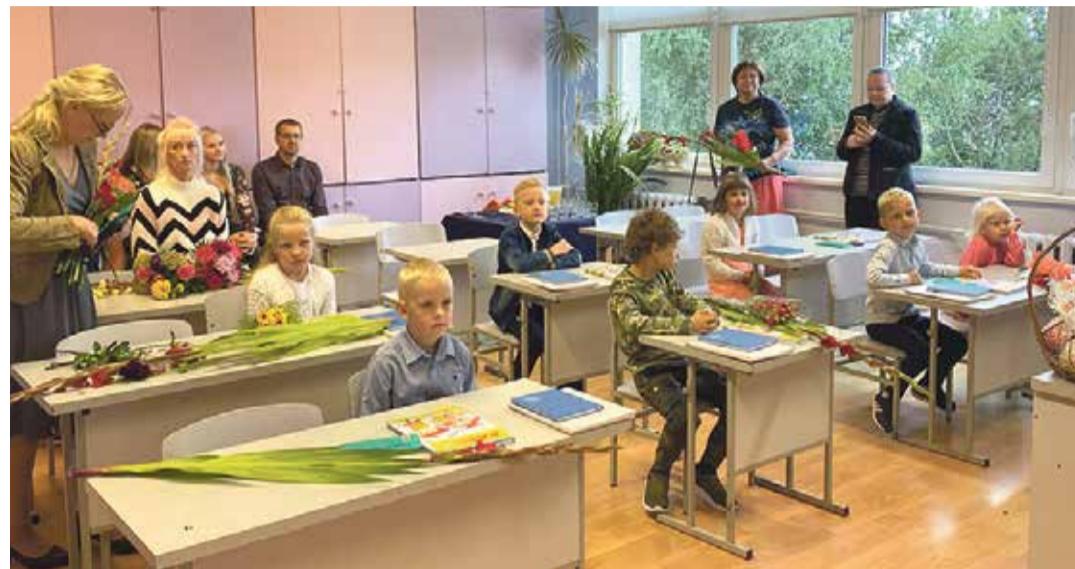
Esimene koolitund Tilsis põhikooli 1. klassis.