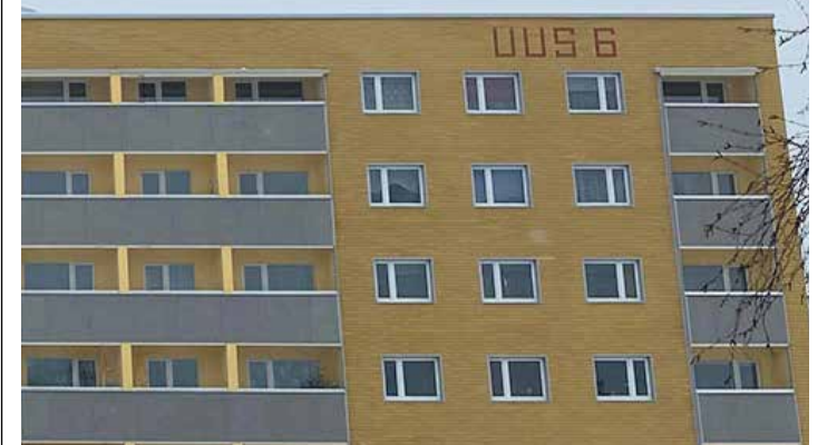
Põlva, Uus 6