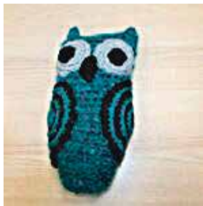
Lissandra Rammo öökull