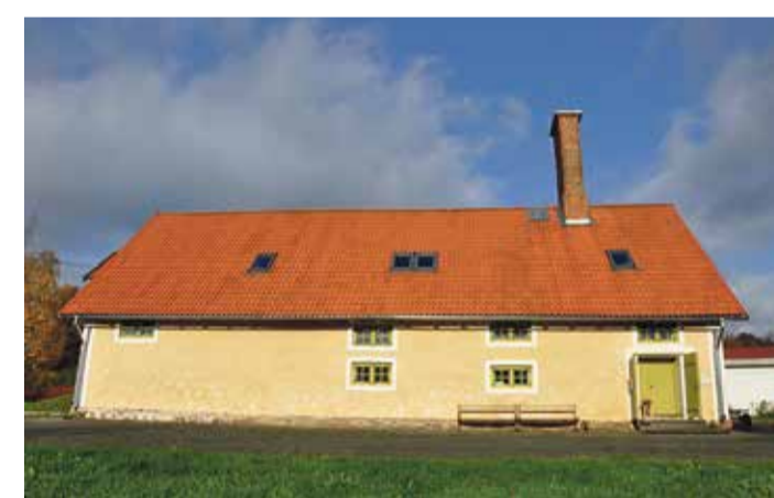
Endine kuivatihooned - Vanaajamaja õppekeskus.