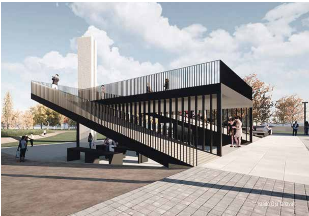
Keskväljaku jõepoolsesse ossa kerkib funktsionaalne lava.

Alanud aastal on Põlva valla fookuses ka noorema astme koolilaste vähenenud kehaline aktiivsus. Tervise Arengu Instituudi juhtimisel otsime tervisedenduse teenusedisaini projektis kompleksset strateegiat, kuidas innustada 7-10-aastaseid lapsi rohkem liikuma. Teema on aktuaalne ja sellesse panustavad erinevate valdkondade spetsialistid.