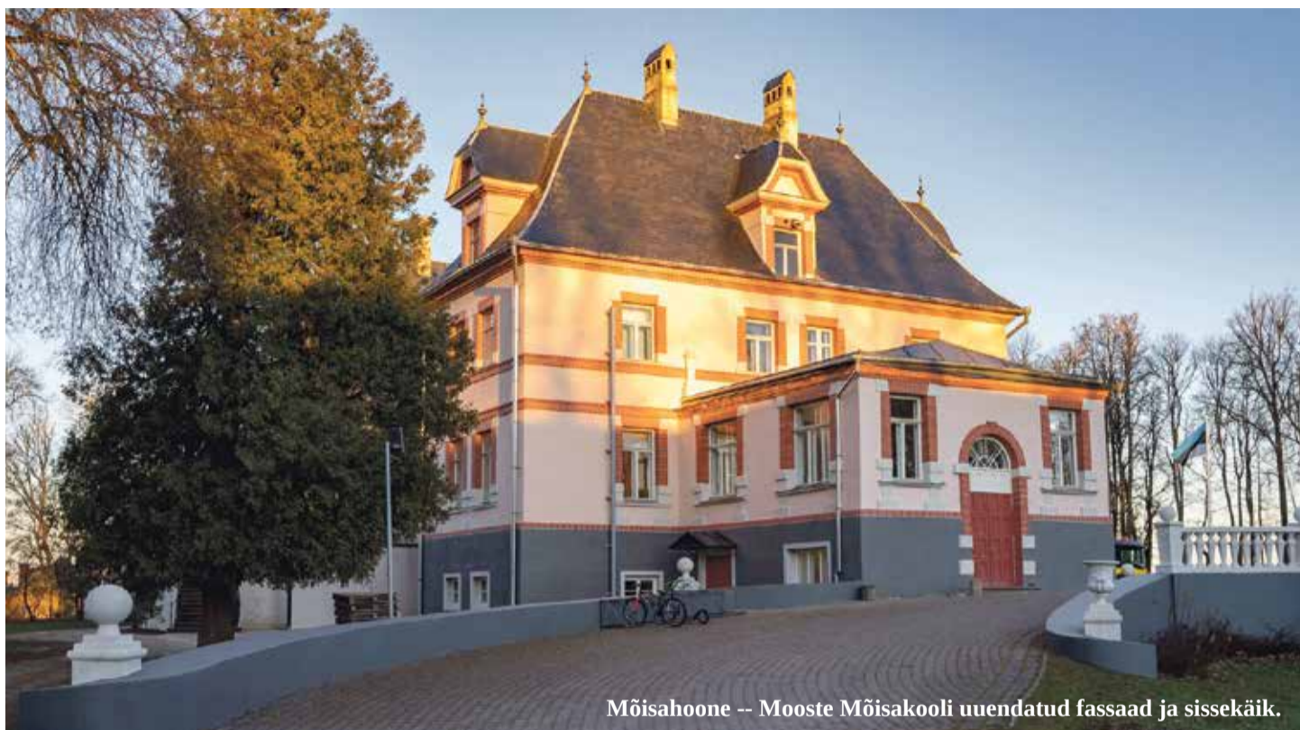
Mõisahooned -- Mooste Mõisakooli uuendatud fassaad ja sissekäik.

Möödunud aasta oli Mooste mõisas tegutsevatele kodadele ja ürituste korraldajatele erakordne. Poolest märstist mai lõpuni hoidis koroonaviirus kõike pausil, ent õnneks olid suvekuud jälle tegusad ja mõisarahalv palju askeldamist.