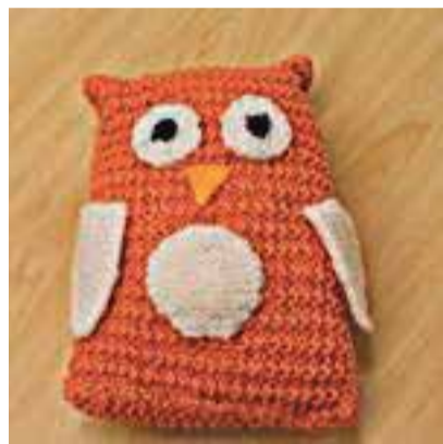
Berit Vasser öökull