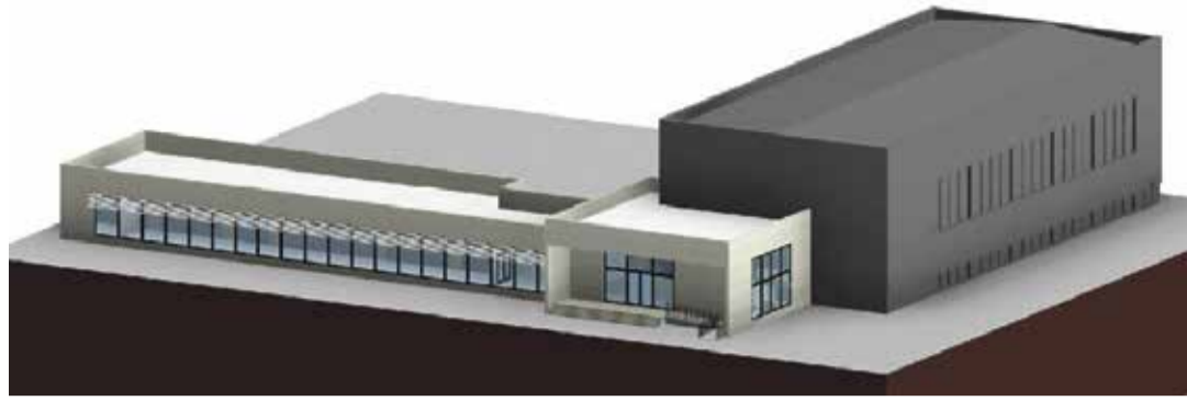
Lina 21 tulevane hoone koos võimlaga. Eskiis

Kui vaadata alanud aasta tegemistele, siis võib kokkuvõtlikult öelda, et tulemas on traditsiooniliste tegevuste, paljude uute algatuste aga ka kauaoodatud investeeringute aasta. 2021. aastal on Põlva vallas investeeringuteks planeeritud kokku ~14,7 miljonit eurot, millest ligi kolmandik on toetusega saadud rahastus.