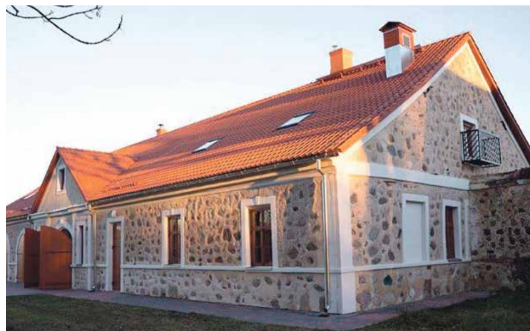
Endine sõiduhobuste tall – traditsioonilise ehituse õppekeskus.