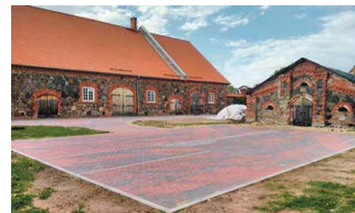
Folgikoja esinejate parkla.