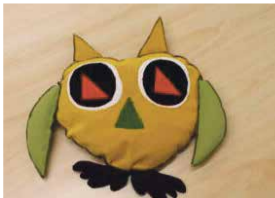
Pilleriin Käo öökull