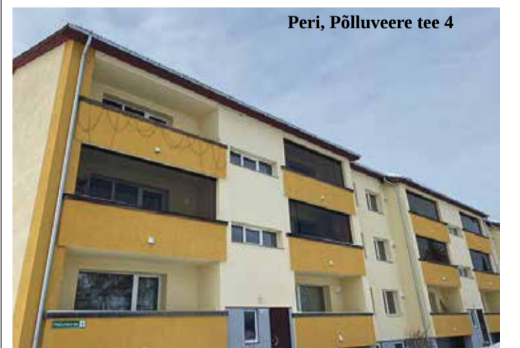
Peri, Põlluveere tee 4