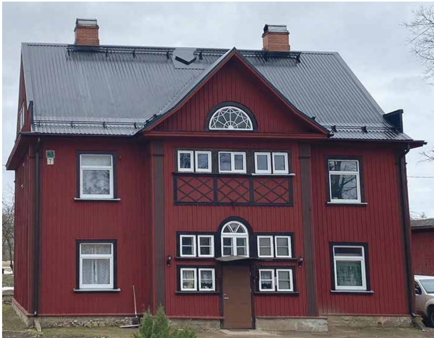
Põlva muutub järjest kaunimaks! Põlva, Jaama 79.