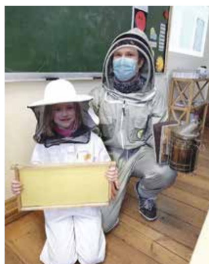
Liiast saaks suurepärase abimesinik.