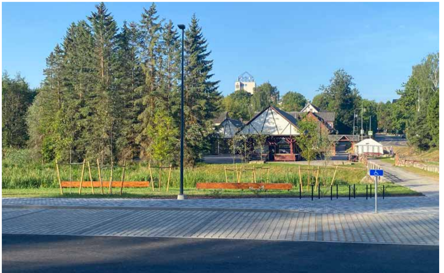
Jõeäärne keskväljakuga ühtset stiili järgiv vaba aja ja parkimisala Põlvas.