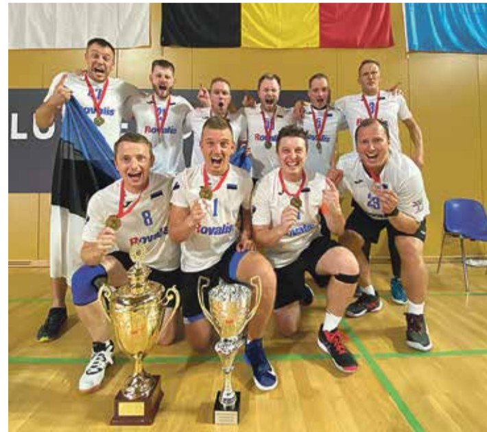
Kuldne meeste võistkond.

2. – 6. augustil toimusid Luxemburgis kuendat korda Indiac Maailmameistrivõistlused. Eesti koondis oli välja pannud võistkonnad kõikidesse kategooriatesse. Põlva indiacaklubist kuulus koondisesse 5 mängijat, kellest lõpuks neli krooniti maailmameistriteks.