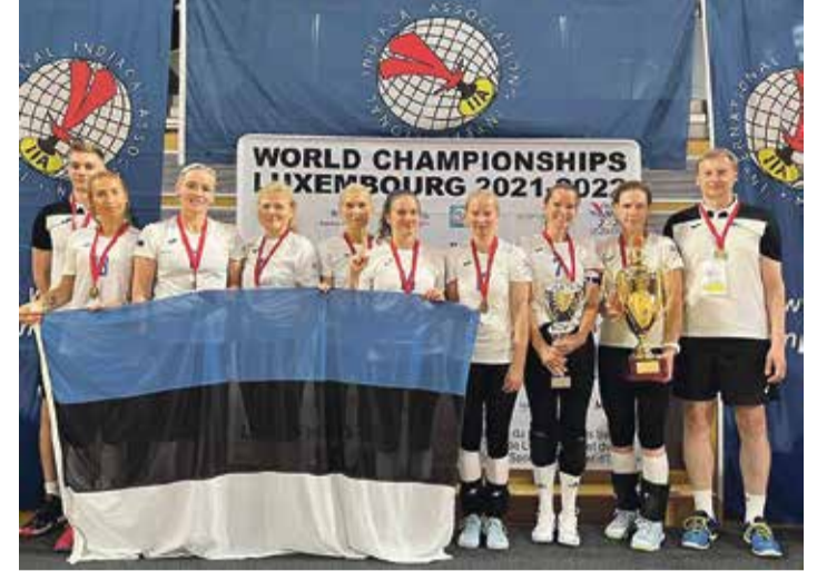
Kuldne naiste võistkond.

Poolfinaalid kujunesid omamoodi thrilleriteks. Avatud klassi mees- ja segavõistkond said rasked 2-1 võidud. Meeskond oli eriti raskes seisus just teises geimis, kus vastas olnud Luxemburgi satsil oli kasutada mitu matšpalli. Lõpuks siiski suudeti geim võita skoo-