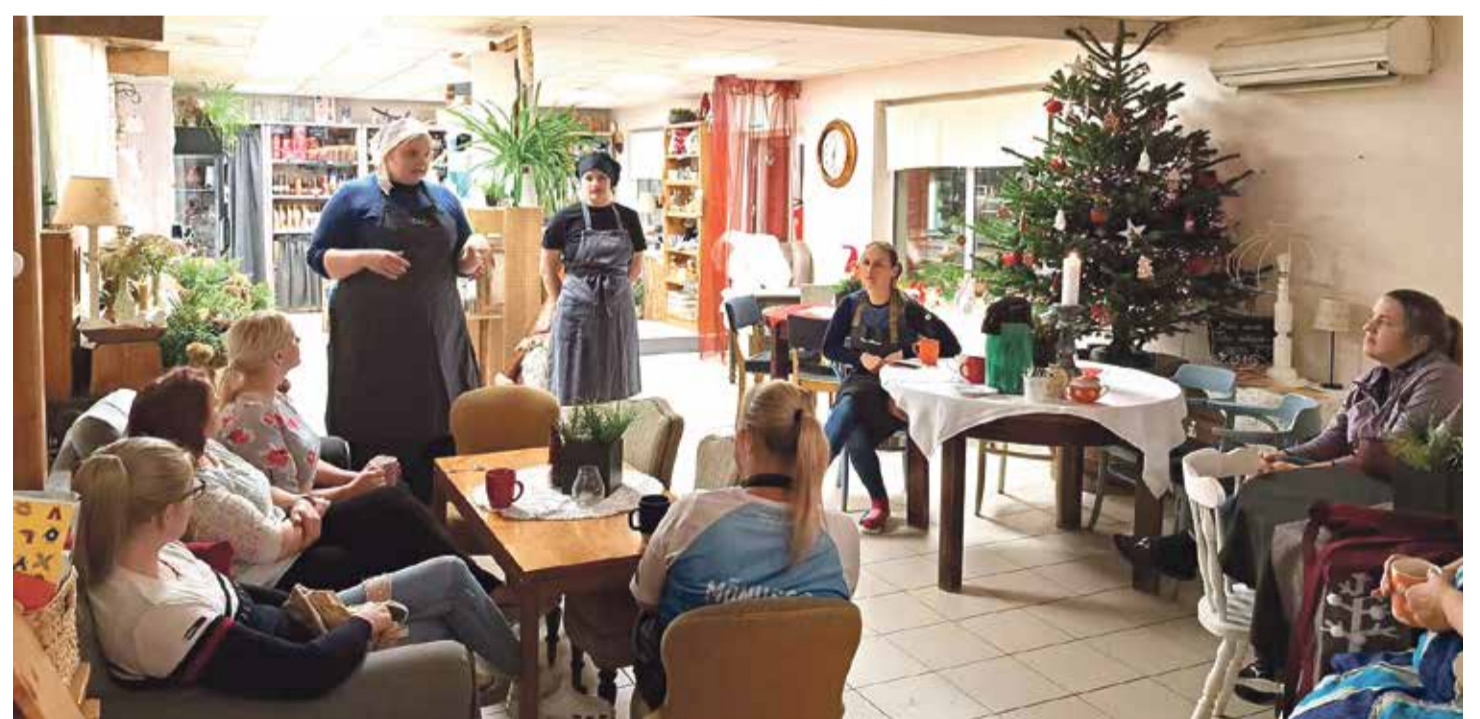
Kringli küpsetamise õpituba Tillu Kodukohvikus Põlvas.

9. juunil toimus ühingu Üldkoosolek, kus sai valitud uus juhatuse. Veidi enne seda toimus Kagu-Eesti Lasterikaste MTÜ endise juhatuse tänuõhtu Põlva minispaas Sõstar. Ühingu 3. sünnipäeva tähistasime Kaldavere turismitalus. Kolmandat suve järjest toimus juulikuus meie ühingu koolinoortele mõeldud Looduslaager, sel korral Kiisa jahi- ja matkamaja territooriumil. Suve lõpus aga nägi ilmavalgust meie ühingu väikene eksprompt-projekt - Kagu-Eesti Lasterikaste laste lauluansambel! Ansambliga sai esinemas käidud päris mitmel vahval sündmusel. Veel enne sügist toimus taas Eesti Lasterikaste Perede Liidu heategevuslik koolitarvete kogumise kampaania „Lapsed kooli!“. Esmakordselt kooliteed alustasid ühingu perede lapsed saime õnnitleda juba traditsiooniks saanud sündmusel „Rõõmuga kooli!“, kus sel aastal pidasime Mammaste Tervisespordikeskuse õuealal vahvat aardejaht. 20. augustil kohtusid aga Tartu Pereli-