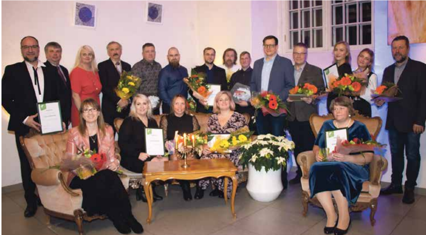
Maakondlike tunnustuste laueraadid.

Põlvamaa Arenduskeskus ja Põlvamaa Omavalitsuste Liit andsid üle tunnustused Põlvamaa 2022. parimatele ettevõtjatele ja vabauhenduste esindajatele ning samuti anti välja ettevõtlikuma kooli tiitel. Põlva vallast pärvised tunnustuse: