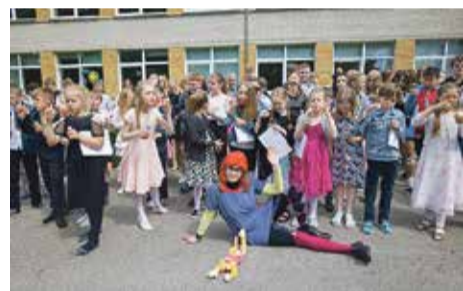
Pipi pannkoogipäev Vastse-Kuustes.