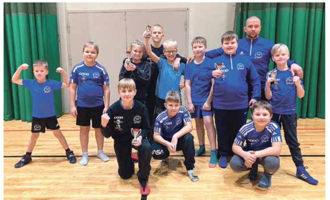
Maadlejad Eesti karikavõistluste finaalettapile Viljandis.

• 26. novembril toimus Põltsamaa vallas Pisisaares 16. noorte vabamaadluse seeriavõistluse finaalettapp. Seeriavõistluse etapid toimusid Rakkes, Põlvas, Võrus, Cesises ning Pisi-