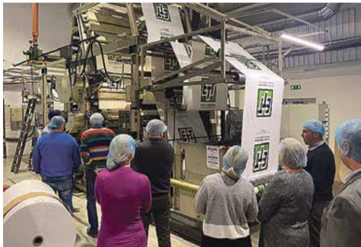
Uudistamas Estiko Plastaris.