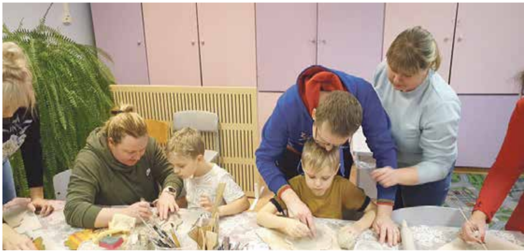
Õhtukoolis Tilsi koolis.