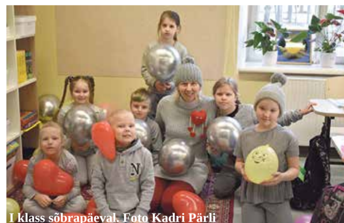
I klass sõbrapäeval.

Veebruar oli meil mõisakoolis raske kuu: kurikaval viirus murdis paljud meist maha ning pidime jääma mõneks ajaks distantsõppele. Õpilased olid kurvad, sest ära jäi pikalt oodatud sõbrapäeva stiilipäev ning postkaartide jagamine ning teisedki plaanitud üritused. Me ei andnud aga niisama lihtsalt alla!