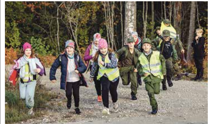
Matkamängu lõpujooks.