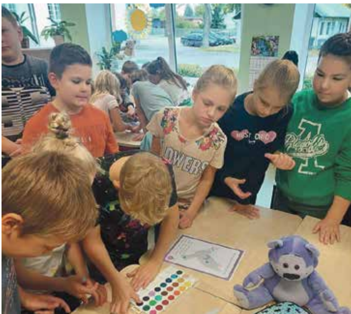
4. klassi õpilased kinnitavad sõrmeljäljega rahu hoidmise lubadust.

Kuna oktoober on vaimse tervise kuu, siis otsustasime koolis sel kuul pöörata erilist tähelepanu just vaimse tervisega seonduvale.