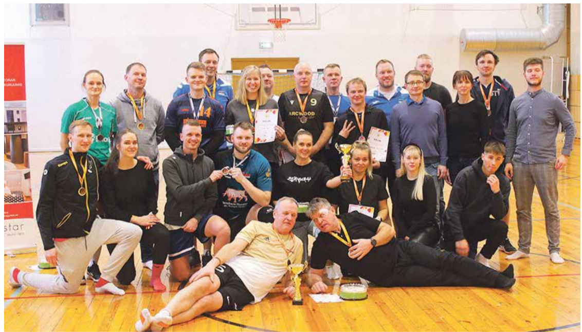
Torditurniiril osalejad.