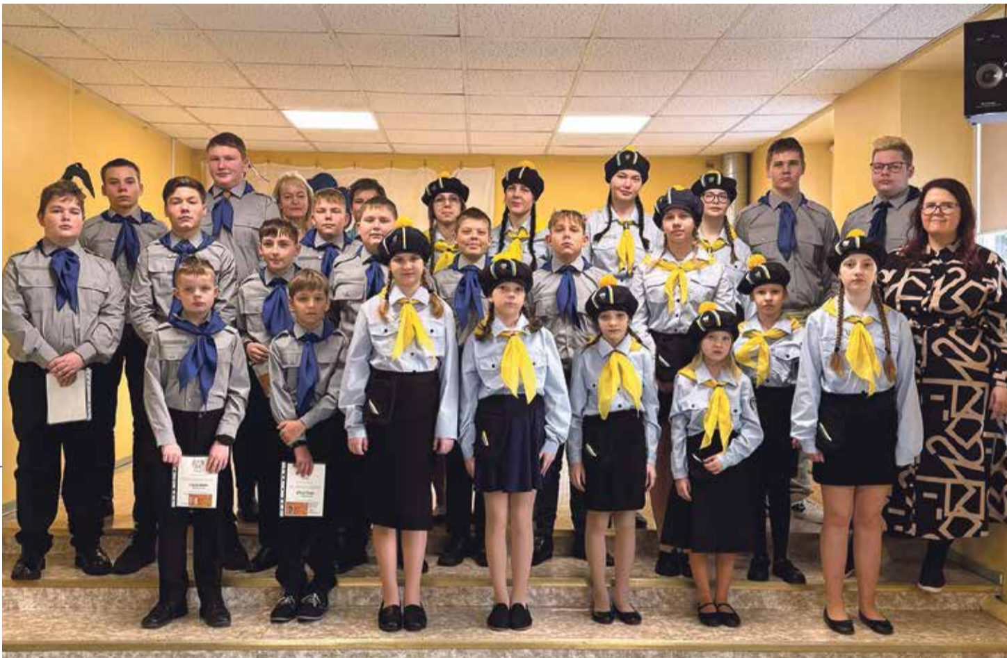
Vastse-Kuuste maja noorkotkad ja kodutütred koos rühmanem Lisetega.

Vastse-Kuuste rühmaga on sel õppeaastal liitunud ametlikult 12 liiget, mis on viimaste aastate rekord ning see tähendab, et Põlva Kooli Vastse-Kuuste majas on pea pooled õpilastest noorkotkad või kodutütred. Eriti tore on näha, et soov organisatsiooniga liituda tuleb õpilastelt endalt ja enamasti liigub info põnevatest tegemistest just õpilaselt õpilasele.