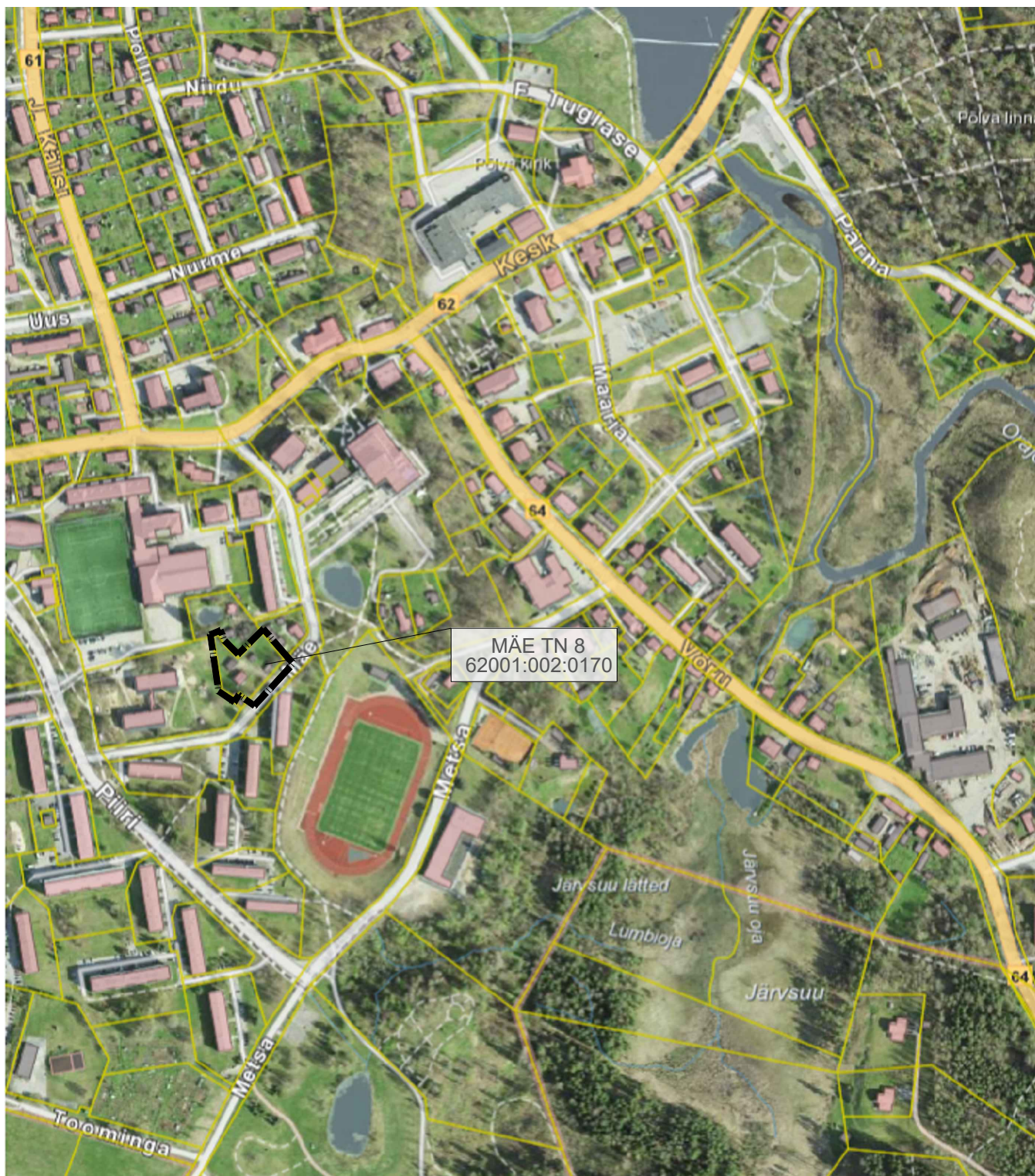
Aluskaart: Maa-amet 2025